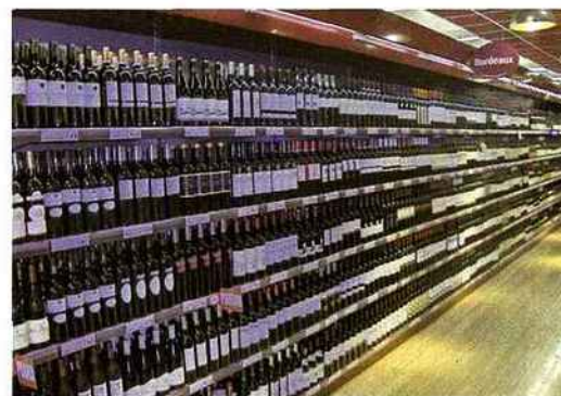
De nombreux vins espagnols et italiens sont proposés dans les foires de Champion en Belgique.

quelques très belles étiquettes pour tous les budgets. D'un barolo 2006 de Marchesi di Barolo, à 25 € à un bardolino classico 2007 de I Terrieri à 4,99 €, en passant par un Viña Esmeralda blanc 2007 de Miguel Torres à 7,90 €. Et les vins français ? Ils sont bien entendu de la partie, avec là encore une forte présence des vins de bordeaux, mais « plutôt les seconds vins que les grands crus classés hors de prix », précise Jean-Michel Jaeger, chef de produits vins et spiritueux du groupe. Parmi ces seconds vins, citons notamment le pessac-léognan blanc Demoiselles de Larrivet Haut-Brion 2004 à 15,50 €, le saint-estèphe Pèlerins de Lafon-Rochet 2002 à 15,50 € ou encore le margaux Manoir de Rauzan-Gassies 2005 à 14,99 €.