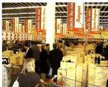
Cora a construit une grande partie de sa réputation sur les séances de dégustation qu'elle organise chaque année.

Alors qu'en France, les foires aux vins démarrent chaque année un peu plus tôt, en Belgique, on aime prendre son temps. C'est le cas de Cora, dont l'édition 2008 ne démarre pas avant la deuxième semaine d'octobre. En revanche, cette foire aux vins dure plus d'un mois. Comme chaque année depuis 1986, les clients peuvent s'appuyer pour faire leur choix sur le petit Guide des vins édité à cette occasion par l'enseigne. Des dégustations organisées avant la sortie de ce guide, la première semaine d'octobre, sont également prévues. Accessibles uniquement sur invitation, avec un droit d'entrée de 20 € (un bon d'achat de 15 € est remis en contrepartie), ces séances, d'une durée de 2 h 30, proposent à la dégustation la moitié des références sélectionnées par l'enseigne. Une soixantaine de vigneron seront également présents pour animer ces dégustations. Vous y retrouverez notamment le cahors 2005 du domaine Chevaliers d'Homs (proposé à 9,99 €) ou le minervois Aragonite 2006 de Franck Benazet (8,99 €). Sur les 412 références sélectionnées pour