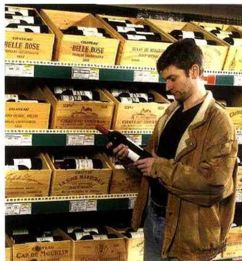
Le catalogue spécial foire de Colruyt est envoyé à 1,8 million de foyers belges.

« Nous proposons des grands crus, mais nous offrons aussi de belles réductions de prix qui pourront aller jusqu'à moins 30 % », indique Stéphane Wauters, l'acheteur vins de l'enseigne Delhaize. La foire aux vins des magasins Delhaize, c'est un peu les soldes ! La plupart des vins bénéficient d'une remise conséquente, comprise entre 25 et 30 %. Une centaine de vins sont concernés par la foire, dont environ 30 % de bordeaux. Vous retrouverez les mêmes