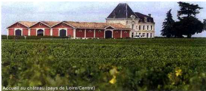
Accueil au château (pays de Loire/Centre)