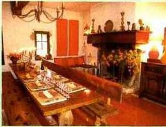
Table d'hôte en Pays de Loire