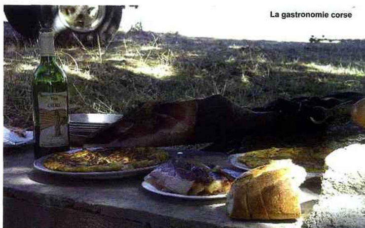
La gastronomie corse

Pour en savoir plus : www.cheval-daventure.com