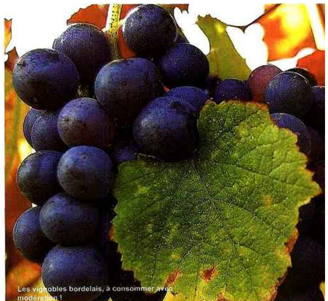
Les vignobles bordelais, à consommer avec modération !

Pour en savoir plus : www.randofontaine.com ou fiche fournie par Ate-lot.